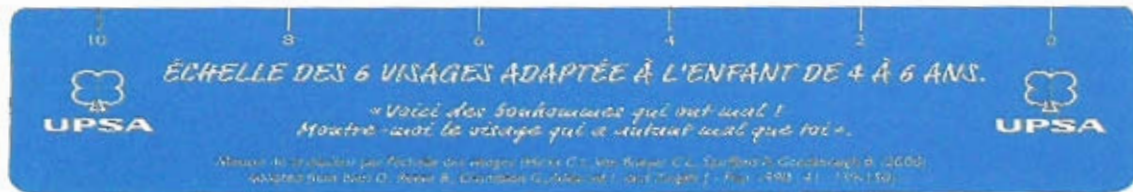
Face à avoir vers soi

Echelle des 6 visages adaptés à l'enfant de 4 à 6 ans (institut UPSA de la douleur)