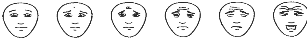
Face à montrer à l'enfant