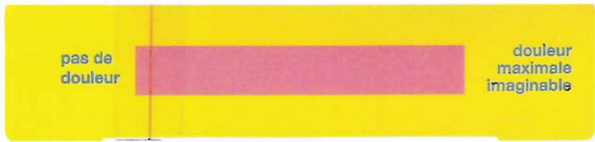
Face à montrer au patient